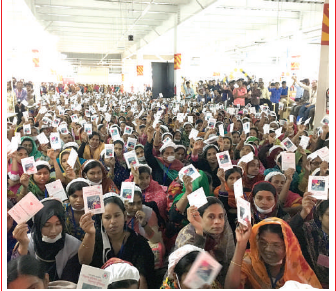
আরএসসি একটি নিরাপদ কর্মপরিবেশের জন্য শ্রমিকদের অধিকার নিশ্চিত করে।