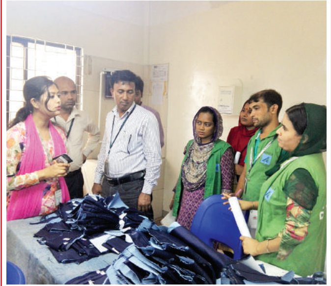
একটি নিরাপদ ও স্বাস্থ্যকর কর্মপরিবেশ প্রদান করা কারখানা ম্যানেজমেন্টের দায়িত্ব।